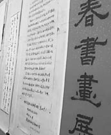
修武县文联举办的迎春书画展