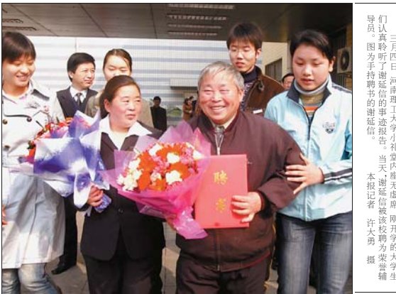
三月四日, 河南理工大学小礼堂内座无虚席, 谢延信先生先进事迹报告团正在该校进行报告。图为手持聘书的谢延信先生。

8时许, 谢延信先生先进事迹报告团还未抵达, 校园内聚集了800多人的小礼堂却早已坐得满满的。假期里在电视上看到了谢延信, 他的事迹令人感动, 我就是想来看看现实生活中的谢延信究竟是什么样子的。一位在门口焦急地寻找座位的同学说, 由于会场座位有限, 记者看到, 还有不少同学徘徊在场外。