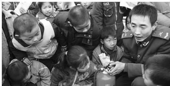
解州地区志愿者坚持志愿服务活动常态化,是新年期间,志愿者活动仍随处可见。二月十七日,解州地区志愿者协会消防宣讲队的青年志愿者来到该区上白作街道消防中队,为那里的学生们上了一堂生动的消防知识课。图为消防战士正在为该校的孩子们讲解如何使用消防器材。

有奖征集新闻线索 读者所提供的新闻线索一经采用,即给予价值50-300元的奖品一份。 爆料电话:3934397 奖品提供: 焦作市现代精品商务中心 电话:2930008 河南贝特文化发展有限公司 电话:2769998 生产和中心专门设计、生产和销售旅游纪念品及外事、商务、收藏等文化礼品。