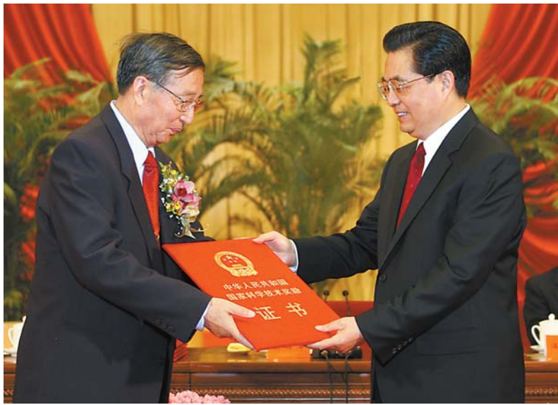
中共中央总书记、国家主席、中央军委主席胡锦涛(右)向获得2006年度国家最高科学技术奖的中国科学院院士、中国科学院遗传发育所研究员李振声颁发奖励证书。

国家科技奖励办公室负责人表示,中小型民营科技型企业以技术创新为先导,以体制创新为动力,以市场需求为导向,以创新人才为核心,形成了技术创新和市场开发的良性互动,已逐步成为我国技术创新的一支重要力量。