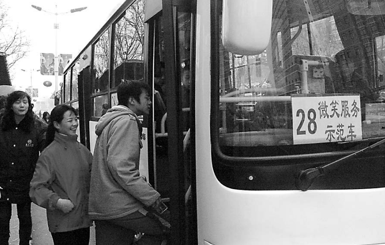
国家文明线路28路公交车正在运营。

网友[规划计](云台社区)：本人觉得焦作大部分公交站设置不合理，按目前的站台设置会增加公交公司的很多运营成本。 靳军：公交站台的设置要受到地域的影响，要考虑道路的通行能力，不然在车辆多的地方设置站牌，会影响交通。 网友[焦作市民某某某](云台社区)：塔南路上的太极景润花园和恒基花园旁没有一个公交站，对于附近的小区居民来说，十分不方便！如果要走到最近的一个公交站旁，需要10多分钟，我们不可能逛商场也得开车去，孩子上学也要很早起来，做家长的很不忍心让他们天还没亮的时候就出门。所以我希望能够在太极景润花园和恒基花园旁设置一个公交站，或者把摩登市旁边的小区台移过来，解决市民的乘车需求！ 网友[游客](云台社区)：深有同感。希望尽快在太极