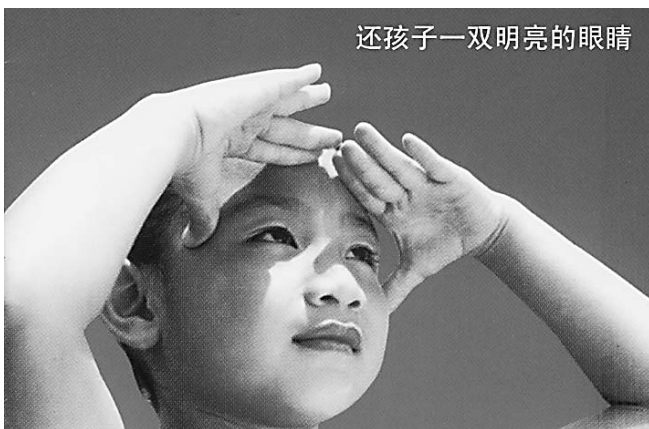
还孩子一双明亮的眼睛