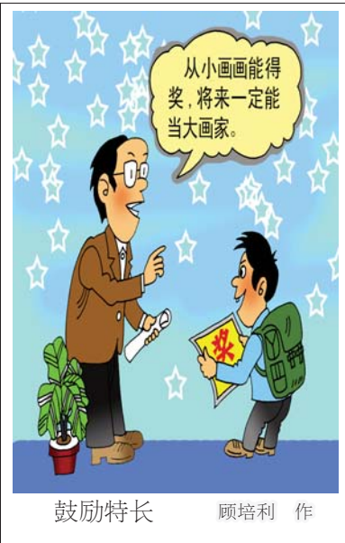
鼓励特长 顾培利 作