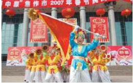
“春满中原”焦作市 2007 年春节民间文艺展演昨日在市东方红广场拉开帷幕。图为孟州市会昌办事处西街盘鼓队表演的《丰收锣鼓》。