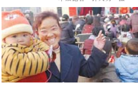
山阳区中街街道福源村河村为了丰富村民的文化生活,请来剧团来村演出,使村民过足了戏瘾。