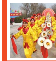
从农历正月初八开始,解放路七个街道办事处群众自发组成七支文艺队伍,每日下午七时,在街道办事处门前为群众表演节目的群众正在演出。

认真落实水库移民后期扶持政策 全国电视电话会议对此提出要求 本报讯(记者 刘佳) 全国水库移民后期扶持政策实施工作电视电话会议昨日下午召开。市委副书记、市长路国贤,副市长王秉新在焦作分会场出席会议。会议总结了前一阶段全国水库移民后期扶持政策实施工作情况,分析了当前面临的形势,要求各级政府、各有关部门进一步统一思想、提高认识,加强领导,明确责任,狠抓政策落实,并部署了下一阶段全国水库移民后期扶持政策实施工作。 新中国成立以来,我国新建了一大批水库,广大水库移民为此作出了重要贡献。为此,国家出台了一系列政策措施,加大对水库移民的扶持力度。会议指出,各级政府、各有关部门要充分认识落实水库移民后期扶持政策的重大性和紧迫性,将党中央、国务院对广大水库移民的关怀尽快送到千家万户。会议要求,各级政府要及时作出部署,及时将会议精神传达到基层,并按照此次会议精神的要求提高认识,加强领导,明确责任,狠抓各项措施的落实。 会议强调,各级政府及各有关部门要统筹安排各项工作,重点抓好移民人口的核对应和扶持方式的确认工作,做到移民身份核对应准确,核对应不错、不漏、不偏,把好事办好、办实。