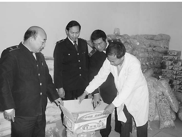
为了解税源,为今年税收工作提供依据,确保全年税收任务顺利完成,新年伊始,孟州市国税局便派出税收人员深入企业调查摸底。图为南庄国税分局的同志在企业了解产品情况。

(上接A1版)符合省委、省政府的要求和焦作实际。市政府下决心建设工业集聚区就是要整合资源,为工业经济又好又快发展创造条件,这是推