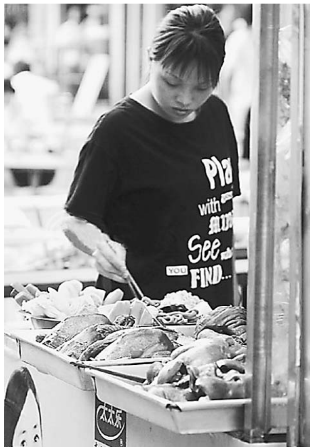
学校周边的一些摊贩销售的油炸食品虽然好吃,却极不卫生。

在塔南路小学大门东边,一连开着四五家小商店,记者来到这里时正赶上下午放学时间,孩子们一出校门便将这些小商店围得水泄不通,争着去买小食品。记者抬头看这几家小商店的店名时,发现有的商店的招牌上只写着“出售文具、礼品、玩具”,并没有食品这一项。由此看来,超范围经营是这几家商店的主要问题。