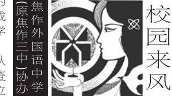
焦作外国语学校(原焦作三中)协办

该校各团支部都成立了“一助一”帮扶困难小组,以团支部为单位,帮助家庭困难和学习上有困难的学生。有的团支部组织团员为贫困生编织手套、毛衣,有的团支部组织团员为成绩落后的学生补习功课,有的团支部组织团员帮助残疾学生料理生活,整个校园充满了温暖。