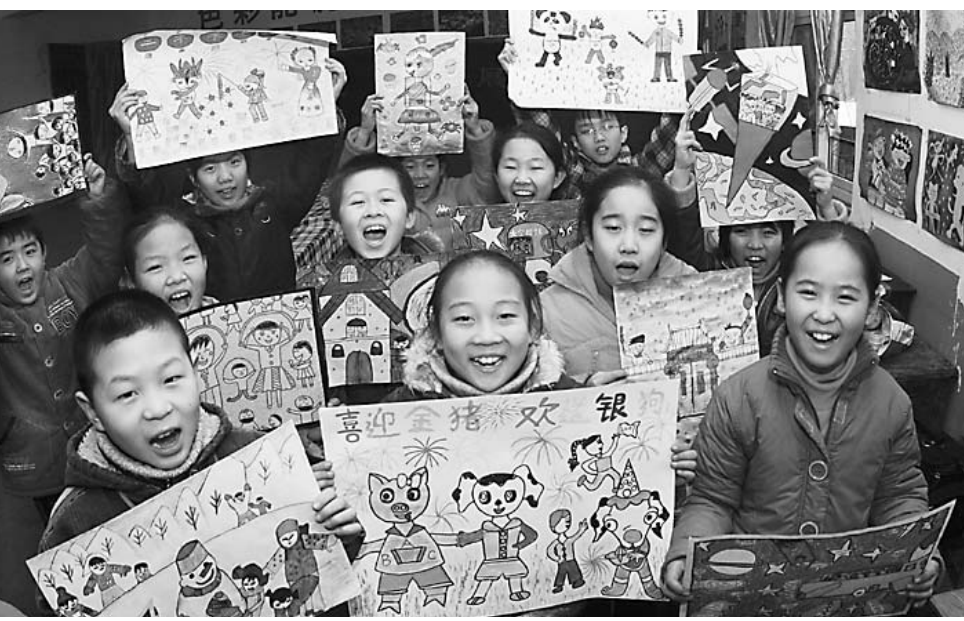
山阳区解东一小十分重视对学生特长培养,先后成立了绘画组、舞蹈组等特长小组,利用课余时间指导学生进行创作和训练。这不,新年伊始,该校绘画组的学生们用画笔描绘出对新年美好愿望。