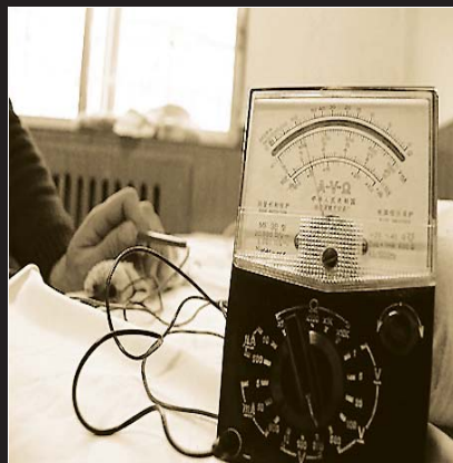
图为通过万能表检测发现, 老马身上带有 220 伏的电压。