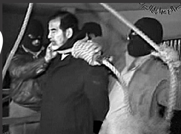
2006年12月30日,伊拉克电视台证实,伊拉克前总统萨达姆·侯赛因已经被处以绞刑。这是萨达姆被处以绞刑的电视照片。