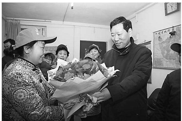
解放区七百间街道办事处太行西路社区活跃着一支由20名低保户组成的志愿者爱心服务队,队员们怀着的一颗颗感恩的心为孤寡老人奉献爱心。图为近日解放区区委书记武磊(右一)正在慰问志愿者,并送去了鲜花和慰问金。

硕果累累酬壮志,疾风猎猎鼓征帆。2006年是“十一五”开局之年,解放区在市委、市政府的正确领导下,围绕建设富裕、文明、和谐、充满活力新解放区的奋斗目标,广大党员干部求真务实,团结拼搏,经济及各项社会事业实现了新跨越,结出了累累硕果。