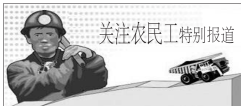
关注农民工特别报道

成立农民工工作联席会议以来,该区共协调各部门解决各类农民工维权纠纷20余起,为农民工追讨工资20万元。 (殷小晴)