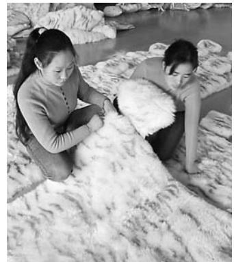
2006年,武陟县围绕国际市场变化,积极引导、帮助、鼓励企业对外出口,使外贸出口额达到950万美元,同比增长69.9%。图为河南华成裘皮有限公司员工正在生产出口产品。