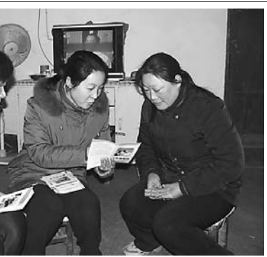
日前,马村区北山街道办事处向社区计生对象广泛开展优生优育知识讲座。

人员周旋。针对这一状况,该局果断采取措施,除加大白天巡查力度外,专门成立2个夜间巡查小分队,为其配备了执法巡查车和强力探照灯等工具,不定期地进行动态巡查,对发现的非法采矿行为当即下达责令停产通知书和处罚决定书,按照法律程序尽快作出处理,对情况严重的非法采矿行为迅速向区政府报告,由区政府组织公安、电力、工商、安监等成员单位赶赴现场进行处理。 (孙永伟 王玉超)