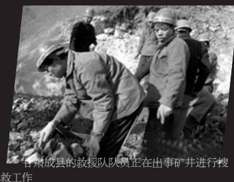
甘肃成县的救援队队员正在出事矿井进行搜救工作

据郭接生估计,仅2006年厂坝矿区越界开采和盗采流失的矿石至少在10万吨以上,损失不可估量。