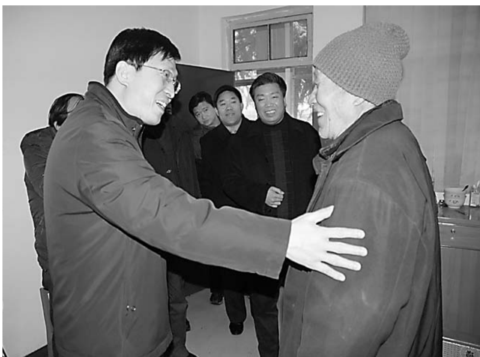
日前,孟州市委书记胡小平,市委副书记、市长魏超杰等分别深入敬老院、困难户家中走访,帮助他们解决过冬难题,并要求各乡(镇)、办事处做好排查工作,让每个孩子有学上,每个年轻人有活干,每个老年人有所养,建设真正的和谐社会。图为胡小平(左一)等看望该市中心敬老院五保对象时的场景。

企业登记及监管,实施商标战略,提升产业素质和市场竞争力;依法把好市场主体准入关,积极促进产业结构调整和经济增长方式转变。 全力支持新农村建设也是今年工商部门的重头戏。孔德庆表示,要继续深入开展“红盾护农”行动,切实保护农民利益,大力支持、培育和壮大农村经纪人,支持发展“订单农业”,搞活农产品流通;积极支持农业产业化生产经营和农村个体私营经济发展,规范农村市场经营秩序,维护农民的合法权益。