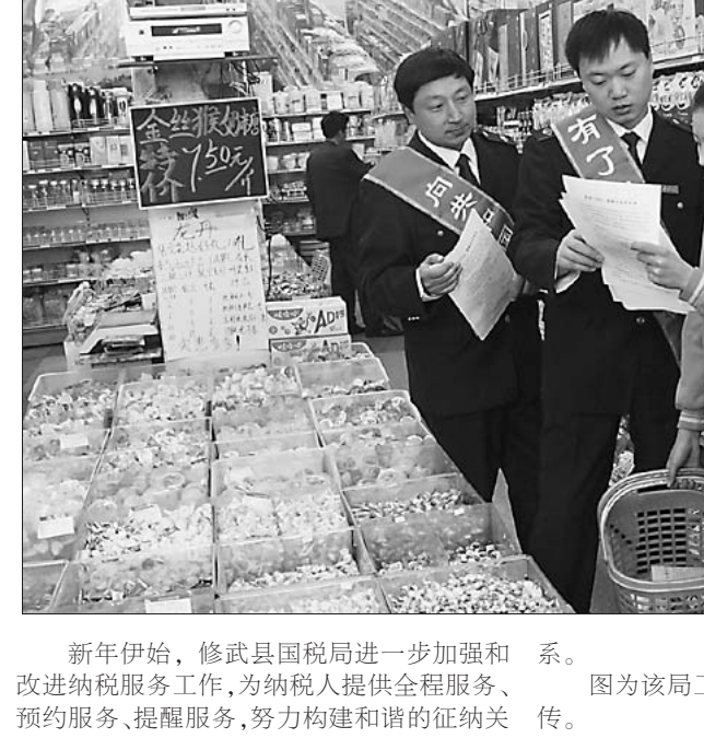
新年伊始,修武县国税局进一步加强和改进纳税服务工作,为纳税人提供全程服务、预约服务、提醒服务,努力构建和谐的征纳关系。 图为该局工作人员在辖区超市进行税法宣传。