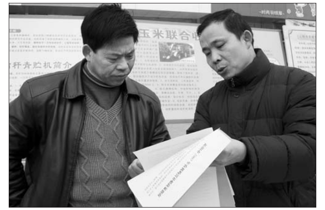
近日,沁阳市开展了“农机科普知识进万家”活动,并针对春节前农民购买力旺盛的实际,在市区主要街道设立了农机购置补贴咨询台,发放农机科普知识资料,宣传政府对购买大型农业机械实行资金补贴的政策,引导农民购置新型农机具。图为该市农机局工作人员(右一)在向进城赶集的农民朋友宣传政府对购置新型农机的资金补贴政策。

打造沁澳、吴华等年销售收入超50亿元的旗舰型企业。育强就是要以149家限额以上工业企业为重点,扶持葛村一机、永威集团、思可达公司、双马公司等现有骨干企业,加快企业技术改造、资源优化组合,对外合资合作,不断扩张规模,努力培育一批核心竞争力强、在国内外影响较大、市场占有率高的大企业。促小就是要促促天益化工、美达精细化工、星博公司等一批高成长性中小企业,向“小而精、小而特、小而专”方向发展,努力形成核心竞争力。解困就是对现有的困难企业采取改革的办法,使其尽快从困境中解脱出来,把死滞、闲置资产盘活,形成新的经济增长点。 提升新农村建设水平,在增加农民收入上实现跨越式发展。通过抓两头、带中间,加快新农村建设步伐,大力发展优质林果、“四大怀药”等特色农业;大力发展劳务经济,多渠道转移农村剩余劳动力;以争创“全国村务公开民主管理先进市”为目标,深入开展民主管理活动,使农村民主管理的范围更广、内容更丰富、程序更规范,效果更显著。 提升城镇化水平,在城乡一体化上实现跨越式发展。以太行路两侧为重点,加快城市基础设施建设,强力推进“一院两校”、招商服务中心、文化中心等重点工程,完善城市功能,同时积极实施“以城带乡、以乡促城、整体联动”的小城镇发展战略,加快西向、西内、柏香、崇义等小城镇建设步伐,推动城乡一体化进程。 提升文化旅游业水平,在繁荣第三产业上实现跨越式发展。要大力实施“文化亮市”、“旅游名市”战略,使文化与旅游融为一体,协调、快速发展;突出神农文化、怀药文化、朱载堉文化三个文化品牌;加强景区建设,加快住宿、餐饮、文化、娱乐等配套服务设施建设步伐,完善旅游基础设施。 提升对外开放水平,在向外型经济上实现跨越式发展。大力实施“开放活市”战略,积极与世界、国内500强企业和华商、豫商500强等大公司、大财团对接,敢于让外商参股、控股,实现以产权换资金,以存量换增量,以市场换技术,加速膨胀发展。 提升平安创建水平,在构建和谐社会上实现跨越式发展。以“八荣八耻”为主要内容,加强社会公德、职业道德、家庭美德教育,深入开展文明创建活动;按照“天理、国法、人情”的理念,探索完善复杂疑难案件“三步走”工作机制,综合运用法律、政策、经济、行政等手段,努力把各类矛盾和纠纷解决在基层,消除在萌芽状态,努力构建和谐社会。