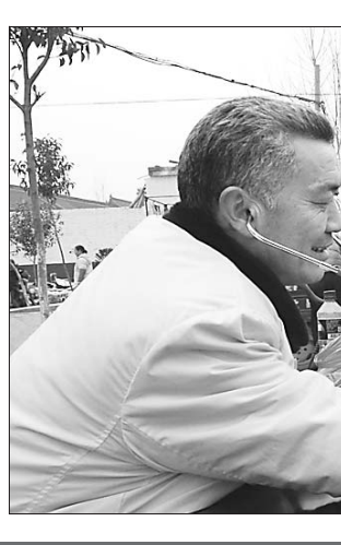
图① 义诊服务热情周到

1月11日,数九寒天,冷风袭来,但在修武县五里源乡磨台营村却呈现一派浓浓的春意。修武县委宣传部组织的文化、科技、卫生“三下乡”活动在这里举行。