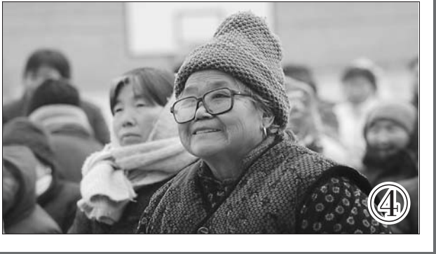
图④ 精彩的文艺节目让人目不暇接