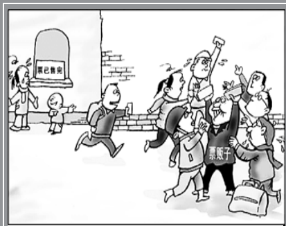
风景这边独“好” 韩恩胜 作

律师解答:从你介绍的情况来看,在你的牵线下木工和你的朋友之间已经形成了劳务合同,还在劳动合同履行期间发生了纠纷。因为和木工形成劳动关系的是你朋友,欠木工劳务费没还的应该还是你朋友。虽然你以自己的名义写下了这份欠条,但是因为你并非劳动合同中的当事人,所以这张欠条并非你真实意思的表示,因此并没有法律效力。木工应当与真正雇用他的人——你的朋友交涉,而不应该把你搅和进来。 马允安 整理