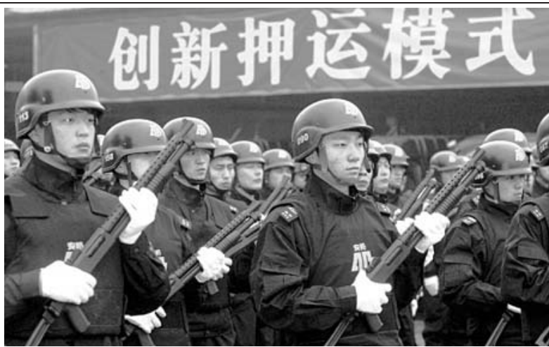
1月17日,在杭州安邦保安公司,24名全副武装的押运人员将工商银行的现金、重要票据等物品安全押运到位,标志着浙江省保安押运工作的正式运行。据悉,浙江省保安押运采用公安机关领导,集团化管理模式,主要服务于各大金融机构。