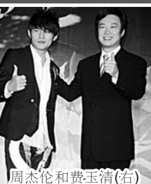
周杰伦和费玉清(右)