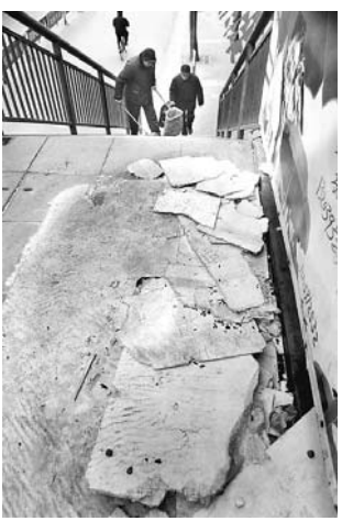
环卫工人清扫垃圾