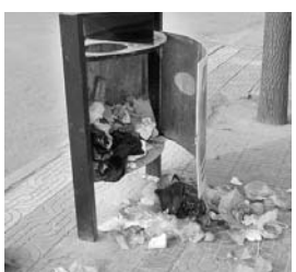
↑近段时间,我市市区一些路段果皮箱被毁严重,果皮箱成了摆设。于迎宾路