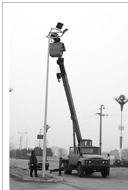
为提升城市品位,近日,孟州市开展了建文明城市、做文明公民活动,把文明城市创建工作引向深入。图为该市政建部门的工作人员正在检修路灯。

齐抓共管,提高城市管理水平;要强化责任,把城市管理贯穿城市发展的全过程;要依法治理,落实“门前五包”政策,分阶段开展集中整治活动;要在全市开展文明城市、做文明市民活动,纠正乱停乱放、乱摆乱占等不文明行为;要加强新闻舆论监督,提高全体市民整体素质。(郭增强)