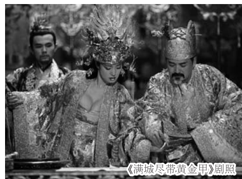
《满城尽带黄金甲》剧照