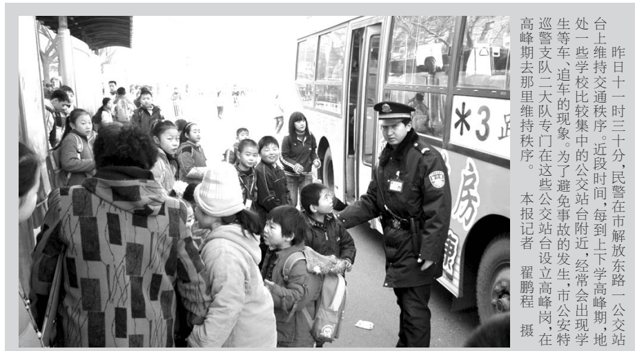
昨日十一时三十分,民警在市解放路一公交车台上维持交通秩序。近段时间,每到上下学高峰期,地处一些学校比较集中的公交车站附近,经常会出现学生等车、追车的现象。为了避免事故的发生,市公安局特巡警支队二大队专门在这些公交车站台设立高峰岗,在高峰期去那里维持秩序。