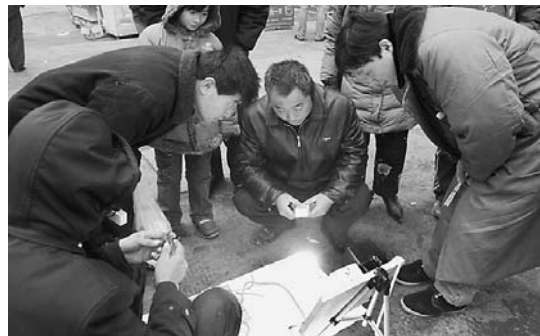
昨日,记者在市贸易大厦附近看到,一个摊主(左一)正在叫卖自己的“节能器”。据摊主讲,只要将他的“节能器”安装在离家中电表300米的范围内,就可节电30%-50%。一位路过此处的市民看后气愤地说,这种“节能器”根本不实用,就是管用这种行为也是偷电。

据了解,我市实施低保政策五年来,共有276万人次领取城市低保金1.54亿元。城市低保标准位居全省第二,一系列的惠民政策让低保户尽情享受党和政府的温暖关怀。请看