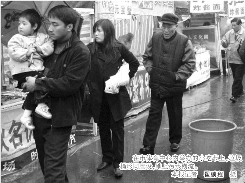
在市体育中心内举办的小吃节上,垃圾桶形同虚设,地上污水横流。

市体育中心一位工作人员告诉记者,此次美食节由重庆金旗会展中心主办,在租用体育中心的场地时双方有过协议,美食节的卫生、治安、消防以及车辆疏导方面的工作都由主办方负责,体育中心负责对其进行监管。主办方走时与山阳区环卫处签订了清理协议,环卫工人已对其进行了清理,但地上的油污无法一下子清理干净。目前,市体育中心已与山阳区环卫处达成了继续清理的协议,并准备了大量炉灰,用来吸收地上的油污。