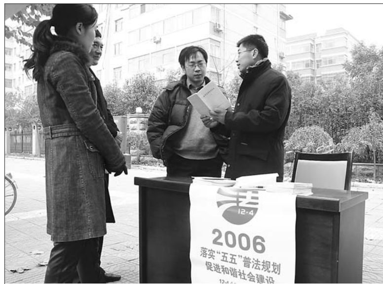
十一月四日是全国普法宣传日。当天,由山阳区司法局联合各社区普法宣传小组,在辖区开展普法宣传,受到了群众的好评。图为工作人员正在给过往群众讲解法律知识。

今年年初以来,该区共有564名农民在农村劳动力转移培训基地接受了非农方面的技能培训,并有近500名农民顺利转移到二、三产业就业。(杜永兵 赵予红)