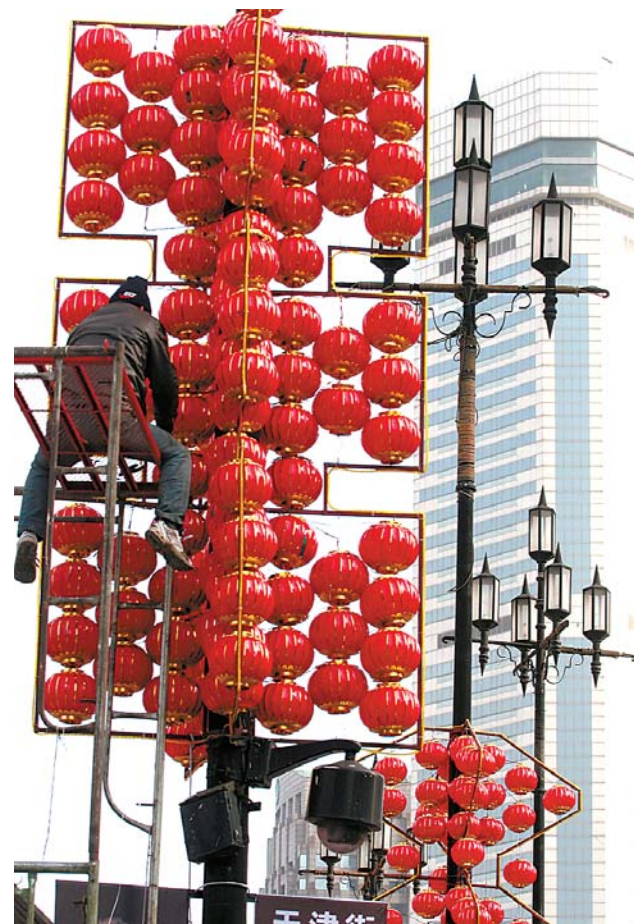
12月2日,工作人员在辽宁大连街头灯杆上组装红灯笼。数千个大红灯笼把大连市胜利广场及周边地区装扮一新,尽显喜庆、祥和。