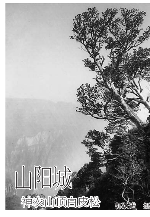
山阳城 神农山顶白皮松

啊,活着就是一种力量,就是一种和谐的力量,就是一种给予他人幸福的力量。就是跳出自私怪圈的力量,就是把爱变成阳光照耀他人的力量。我们从谢延信的身上,看到了大孝至爱、百孝为先的精神,这是民族的传统,这是博大的精神,我们走近谢延信,就是在选择人生的一方净土。