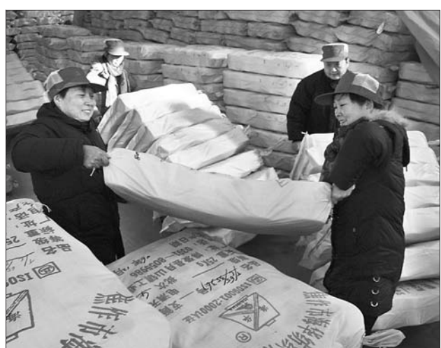
12月13日,是博爱县农发行成立10周年行庆日。该县农发行组织职工到海华纺织公司深入车间与工人一起工作。图为该县农发行的职工正在该公司成品库堆放棉纱。