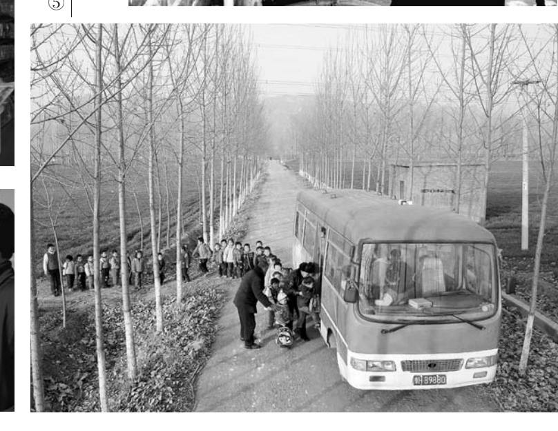
图③近日，在刚修好的黎陵镇黎陵村一乡间道路上，百科幼儿园的学生接送车正在接送学生。