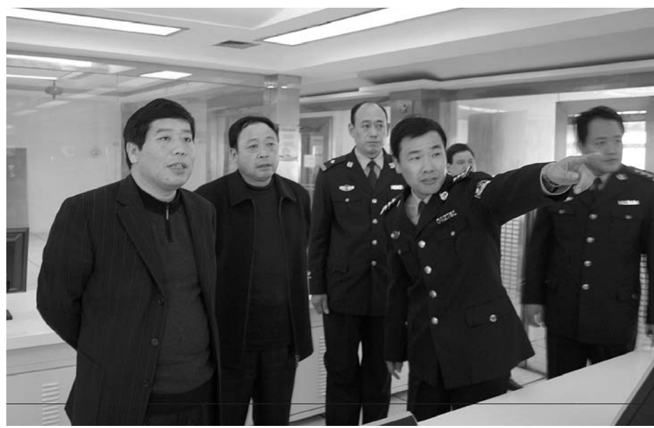
▲12月12日上午，沁阳市委书记史金新、市委常委、政法委书记赵同金，分别到市检察院的法制文化苑、技术楼、公安局的110指挥中心、看守所新址的建设情况进行了察看。史金新希望检察院和公安局抓紧时间建好这些工程，尽快投入使用。图为史金新在市公安局110指挥中心检查工作。