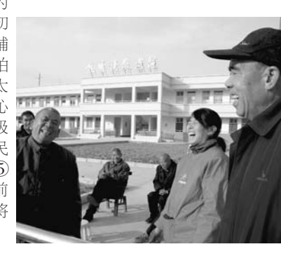
图⑤投资40多万元的柏香镇敬老院，目前已有15名孤寡老人入住。