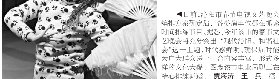
▲日前，沁阳市春节文艺晚会编排方案确定后，各参演单位都在抓紧时间排练节目。据悉，今年该市的春节文艺晚会将充分突出“现代沁阳、和谐社会”这一主题，时代感鲜明，确保届时能为广大观众送上一台内容丰富、形式多样的文化大餐。图为该市电业局职工在精心排练舞蹈。贾海涛 王兵 摄

焦作沁北工业集聚区位于沁阳市西北部，距市区20公里，北至太行山前，南到老焦克路，东至西万镇校尉营村，西至沁洛交界，规划面积35.2平方公里。