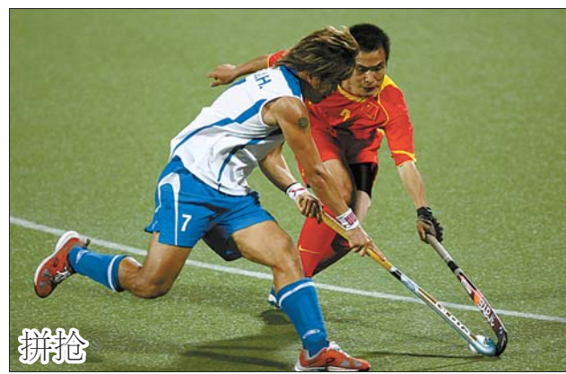
12月14日,在多哈亚运会男子曲棍球决赛中,中国队以1:3负于韩国队,获得银牌。图为中国队球员(右)与韩国队球员拼抢。