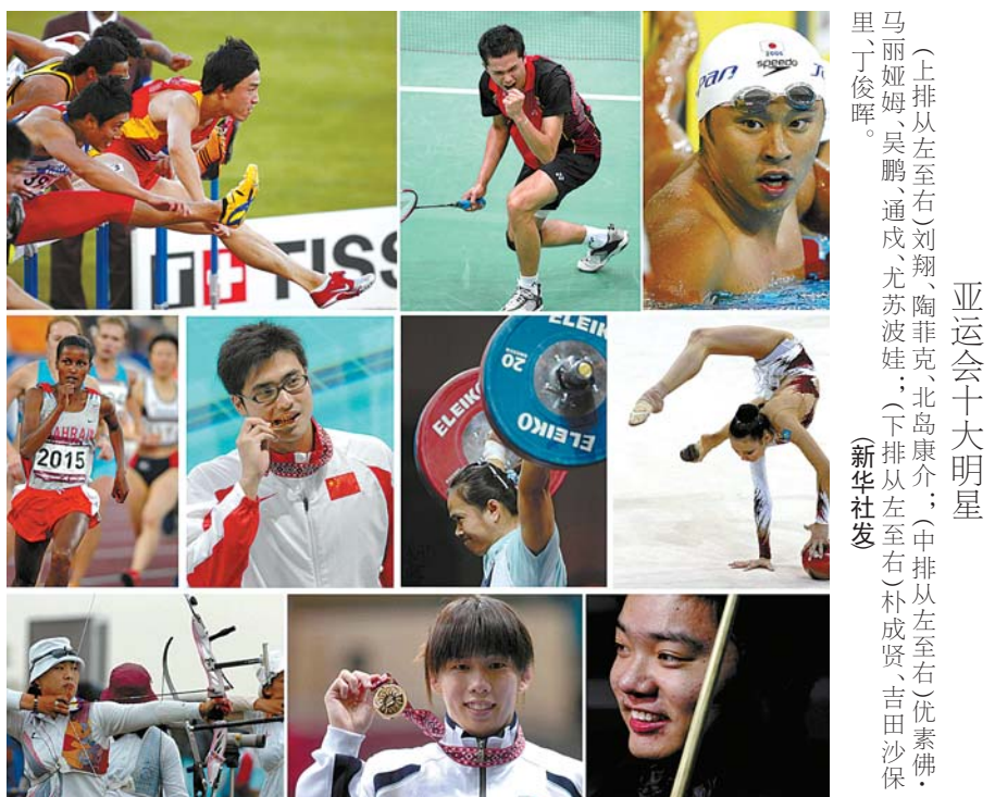
亚运会十大明星 (上排从左至右)刘翔、陶菲克、北岛康介; (中排从左至右)朴成贤、吉田沙保里; (下排从左至右)吴鹏、通成、尤苏波娃。