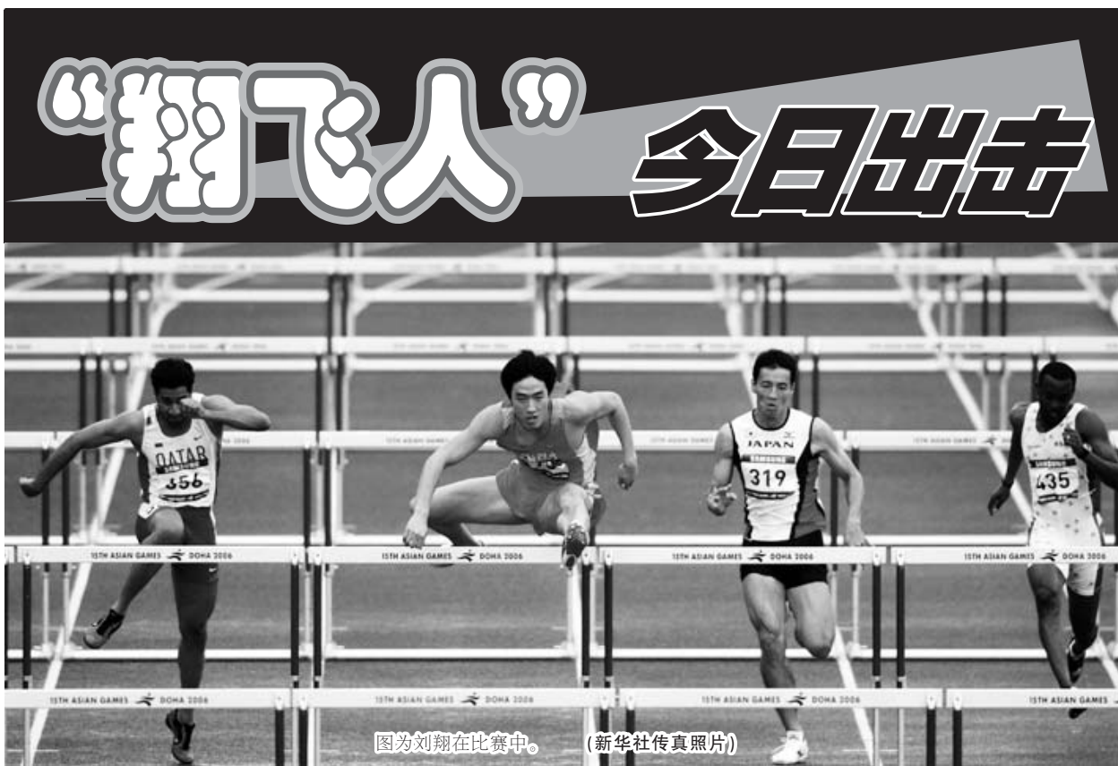
图为刘翔在比赛中。