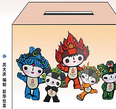
奥运门票将于二〇〇七年上半年开始在中国预售