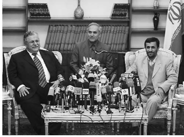
11月27日,伊朗总统艾哈迈迪-内贾德(右)在德黑兰总统府与伊拉克总统塔拉巴尼(左)举行会谈。

新华社德黑兰11月27日电(记者 徐伊伊 梁有昶)应伊朗总统艾哈迈迪-内贾德邀请,伊拉克总统塔拉巴尼27日晚飞抵德黑兰,开始对伊朗进行访问。 据伊朗国家电视台报道,塔拉巴尼在机场受到了伊朗外长穆塔基的热烈欢迎,随后在伊朗总统府同艾哈迈迪-内贾德举行了会谈。根据访问计划,塔拉巴尼28日将与伊朗最高领袖哈梅内伊举行会谈。 伊朗官方20日邀请伊拉克和叙利亚两国总统于上周末在德黑兰举行会谈,重点商讨如何改善伊拉克国内局势等问题,但到目前为止,叙利亚方面并没有对该会谈作出积极回应。塔拉巴尼则接受邀请并曾计划于25日访问德黑兰,但由于伊拉克上周发生一系列爆炸袭击事件,伊拉克当局在巴格达实施3天宵禁并关闭了巴格达国际机场,直到27日才重新开放。 西方国家一直认为,伊朗同伊拉克国内的什叶派武装联系密切。此间舆论认为,塔拉巴尼此行将就伊拉克不断恶化的安全局势向伊朗寻求帮助。自从共和党在美国中期选举中失利后,布什政府一直承受着国内要求其和伊朗、叙利亚接触以稳定伊拉克局势的压力。而艾哈迈迪-内贾德26日则说,如果美国改变对伊朗的霸权政策,伊朗将帮助美国稳定伊拉克局势。