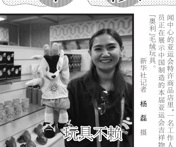
十一月二十六日,在卡塔尔首都多哈新闻中心举行的亚运会特许商品商店里,一名工作人员正在展示中国制造的本届亚运会吉祥物“福娃”毛绒玩具。