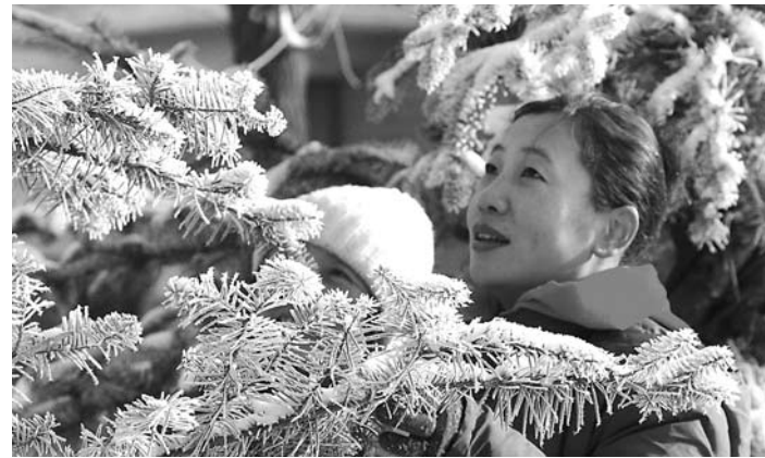
雾凇扮靓北国 二十七日,在哈尔滨市松花江畔,两位市民欣赏雾凇景观。黑龙江省哈尔滨市雾凇景观,吸引了不少市民。