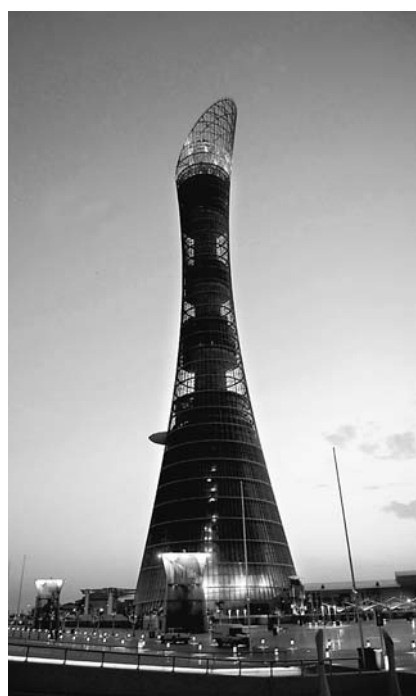
耸立在卡塔尔首都多哈哈里发体育场外的亚运会主火炬塔,高三百一十米,最上面是一个尖尖的斜面,外形很像卡塔尔羚羊角。主火炬塔周身布满红、黄、绿、紫、白等色彩的装饰灯,不断变幻闪烁。这里点燃主火炬塔点分外美丽。十二月一日第十五届亚运会圣火将在这里点燃,如何点燃这支主火炬塔人们正翘首以盼。