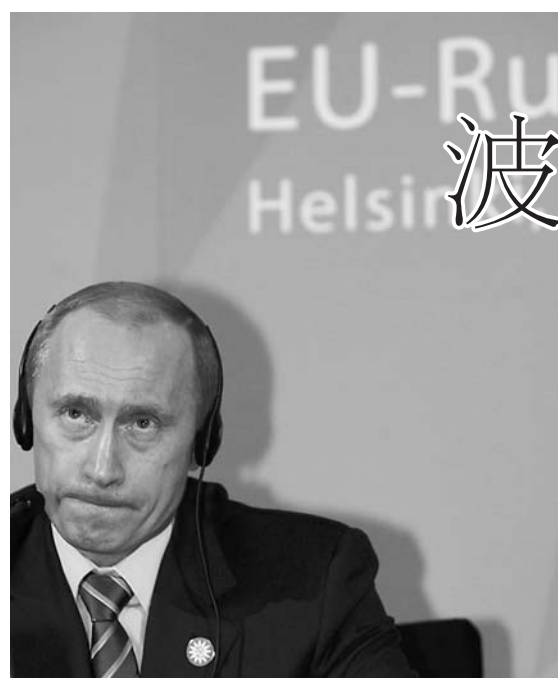
11月24日,俄罗斯总统普京在第十八次欧盟-俄罗斯首脑会议后出席记者招待会。

这种100美元的电脑可以无线上网,而且使用Linux等公开源代码操作系统。内格罗蓬特说,所有的电脑服务器都在巴西生产,到明年1月将有约1000部电脑可供分发。