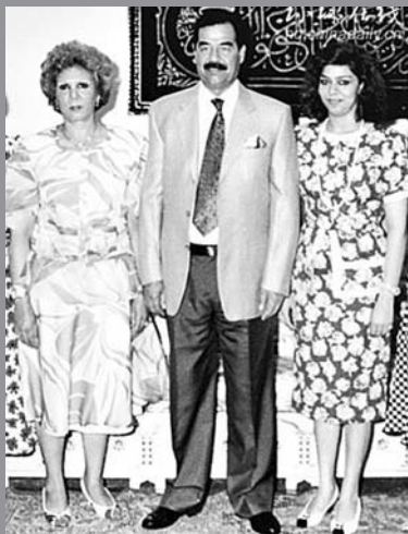
萨达姆与妻子萨吉达和长女拉加德(右)的一张合影。

萨达姆和第二任妻子萨米拉养育一子,名叫阿里。在萨达姆任职期间,关于阿里的话题一直被视为一个禁区,很少