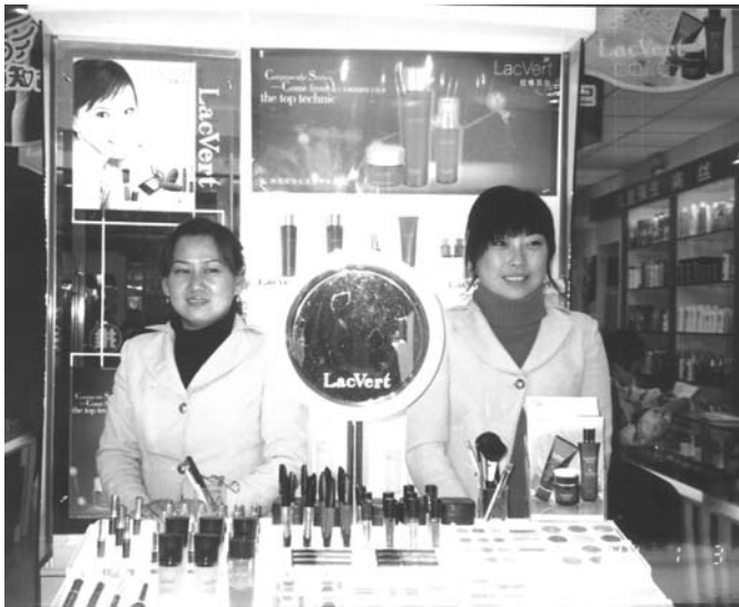
图为“红颜知己”韩国蝶妆专柜。