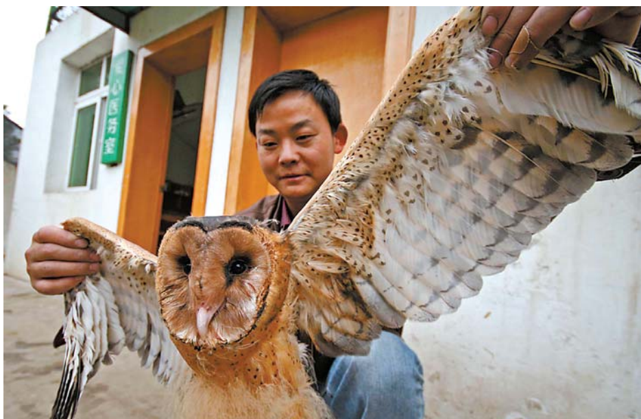
11月21日,东湖鸟语林的工作人员为幼猴面鹰“体检”。当日,武汉市江夏区几位农民将意外发现的四只幼猴面鹰送到武汉东湖鸟语林,工作人员在对其进行检查救治后会将它们放回大自然。据鸟类专家介绍,猴面鹰属珍稀野禽,是国家二级保护动物。

国家质检总局21日公布了各级质监部门对全国蛋制品生产加工企业专项检查结果,结果显示有7家企业的8个批次产品涉嫌含有苏丹红。经进一步核查,质检总局公布了这7家企业的名单。