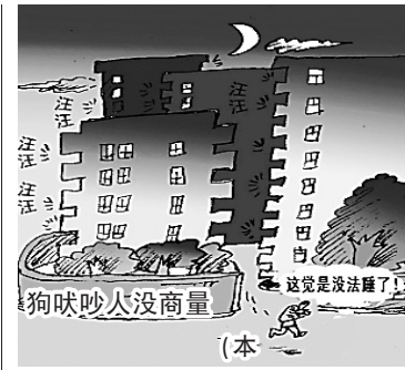
狗吠吵人没商量。