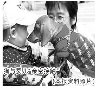
狗与婴儿亲密接触。（本报资料照片）

后注射狂犬疫苗的约有6000人。狂犬病的发病率和病死率多年位居各类传染病之首，已成为我国最重要的公共卫生问题之一，狗患已成为我国城市的一大公害。为杜绝狗患，不少城市发起了“打狗运动”，这一举动引发了社会各界对于狗患的争论。 本网网友在市民留言板栏目中咨询养犬证如何办理，记者通过采访得知，我市目前还没有办理养犬证的地方，市民“养狗”与政府“管狗”存在脱节现象。