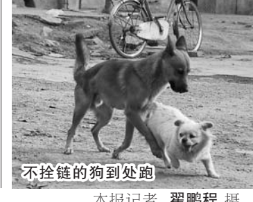
不拴链的狗到处跑。