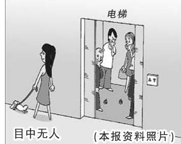
目中无人。