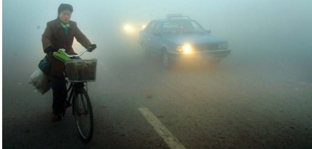
昨日清晨,记者在人民路上看到,由于大雾天气,快车道的能见度很低,车辆开着雾灯在雾中摸索着前行,一些骑车的行人也放慢了速度,小心翼翼地骑行。