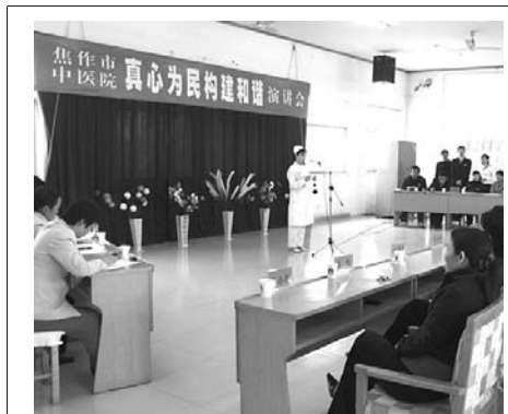
市中医院为了更好地调动广大职工干事创业的积极性,于11月15日下午举办了“真心为民构建和谐”演讲会。

24岁的索普此前曾经赢得9枚奥运会奖牌,其中包括5枚金牌,以及13枚世锦赛奖牌,并且曾经创造了13项长池游泳个人项目的世界纪录。但是自2004年雅典奥运会后,索普一直深受伤病的困扰,在其后的两年多时间里只参加过一些小型的比赛。 (小普)