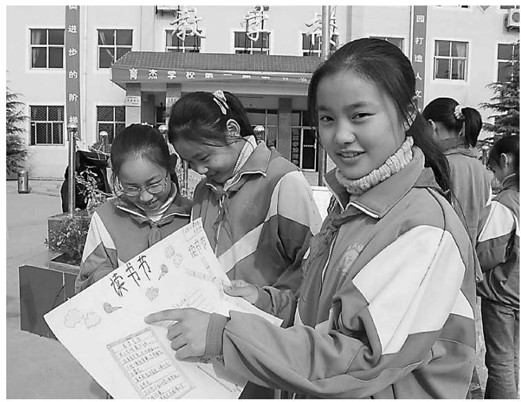
十一月十五日,武陟县育杰学校为两个月的一届读书节正式拉开序幕。学校将通过开展手抄报比赛、黑板报评比、演讲比赛、故事比赛、优秀读书笔记评比、好书推荐等活动,全面提升学生的阅读能力。

等形式对学生进行伦理、心理、生理教育,使学生的精神面貌焕然一新,校容校貌大为改观。(董海军 岳小霞)